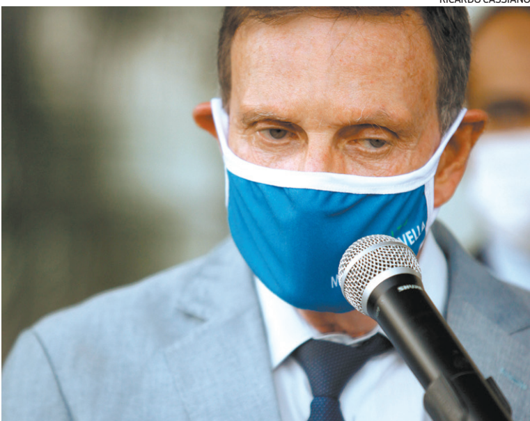
Marcelo Crivella defendeu um forte programa de saneamento básico

O prefeito explica: “Em São Paulo, a Sabesp, que é a Cedae dos paulistas, ela paga 7,5% de royalties para a capital. Aqui, se pagasse a mesma coisa, nós teríamos R$ 180 milhões, em torno disso, para fazer investimento em saneamento nas nossas comunidades. E não conseguimos, porque a Cedae não paga nada. Pelo contrário. Ela pega os dejetos e coloca na rede pluvial. Ela não constrói redes próprias, ela joga na minha rede; a rede do município é essa que pega a água de chuva. Ela joga na nossa rede e causa um terror. É um desastre ecológico. Agora, com a privatização da Cedae, o município entrou na Justiça. Nós fomos ao tribunal pedindo para que a Cedae pague ao Rio de Janeiro os royalties que se pagam em tudo que é canto do mundo. E se for o caso de ser privatizada, aquela empresa que comprar a Cedae precisa negociar com o Rio de Janeiro os investimentos que serão feitos aqui, porque nós somos o maior cliente da Cedae e temos um péssimo serviço”.