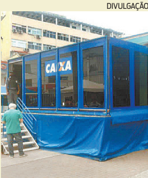
Caminhão da Caixa

■ Um serviço bem interessante... Quem passa desde ontem pela praça Rui Barbosa, no Centro de Nova Iguaçu, observou uma movimentação diferente... E a coluna, curiosa que só, foi apurar pra saber do que se tratava. Era o caminhão “Você no Azul” da Caixa, que vai ficar por lá até sexta-feira, ajudando os clientes do banco a quitarem suas dívidas. O serviço foi lançado no mês passado e vem rodando todo o Brasil. Olha a chance aí! Nessa pandemia, o que não faltou foi gente endividada... Dá pra entender né, todo mundo ficou apertado de grana, não teve jeito. É uma chance de esquecer aquela história de “devo não nego, pago quando puder”. Muita gente ainda está com medo de aglomeração... Por isso, a Caixa afirmou que o serviço pode ser procurado também nas lotéricas, por telefone, WhatsApp ou nas agências! Quem quiser ficar por dentro de tudo antes, é só ir lá no site caixa.gov.br/negociar . Se você me perguntou se tá feio ou tá bonito... Oportunidade de não se endividar é sempre uma boa dica, e tenho dito.