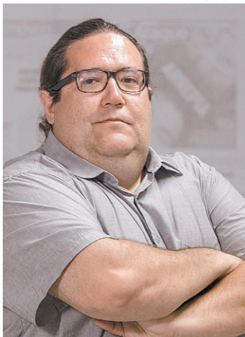
Tarcísio Motta: líder de votos