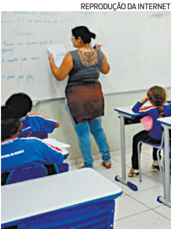
Serão 100 vagas para bolsas

pelo Ministério da Educação. Os interessados devem acessar a página www.ea-depf.rioeducarj.gov.br e se inscrever até 11 de dezembro. Depois de fazer login na plataforma, o candidato deverá acessar o link “Programa Anual de Bolsas” e utilizar a chave de inscrição: Bolsa#2021. Para esclarecer dúvidas ou problemas, é necessário entrar em contato pelo e-mail suporte.eadepf@rioeducarj.net .