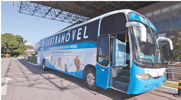
Serão disponibilizadas 270 vagas para as cirurgias gratuitas

Devido à pandemia do novo coronavírus, o horário de votação foi ampliado e ocorrerá das 7h às 17h. O horário entre 7h e 10h é preferencial para pessoas acima de 60 anos, por serem do grupo de risco para a Covid-19. A Guarda Municipal alerta, ainda, a população para o uso de máscara de proteção facial, evitar aglomerações e higienizar as mãos com álcool em gel antes e depois de votar.