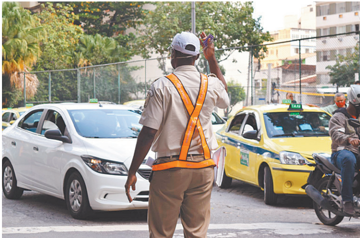
Guardas municipais vão atuar em turnos, seja a pé ou em viaturas

Os guardas municipais vão realizar ações de ordenamento urbano; fiscalização de trânsito; coibindo aglomerações; darão apoio às unidades operacionais no entorno dos locais de votação e poderão ser acionados em caso de necessidade. As equipes atuarão em turnos, a pé e também com auxílio de 58 viaturas e 12 motocicletas em todas as regiões do Rio.