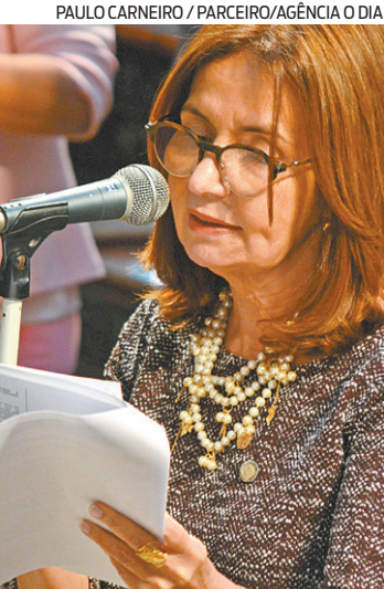
Deputada Martha Rocha

MARCELO FREIXO, Deputado federal (Psol) sobre fake news proferida por Marcelo Crivella