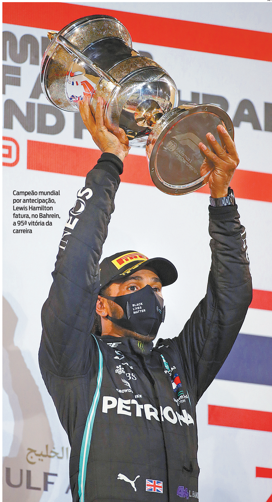
Campeão mundial por antecipação, Lewis Hamilton fatura, no Bahrein, a 95ª vitória da carreira