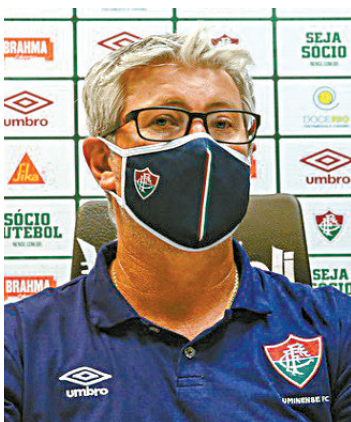
Odair: luta entre os primeiros

“Satisfeito e orgulhoso. Estão dando resposta. Na transição da base para profissional, tentamos criar o melhor cenário possível, dentro de um time consistente, para proteger. Quando mexe muito forte na estrutura