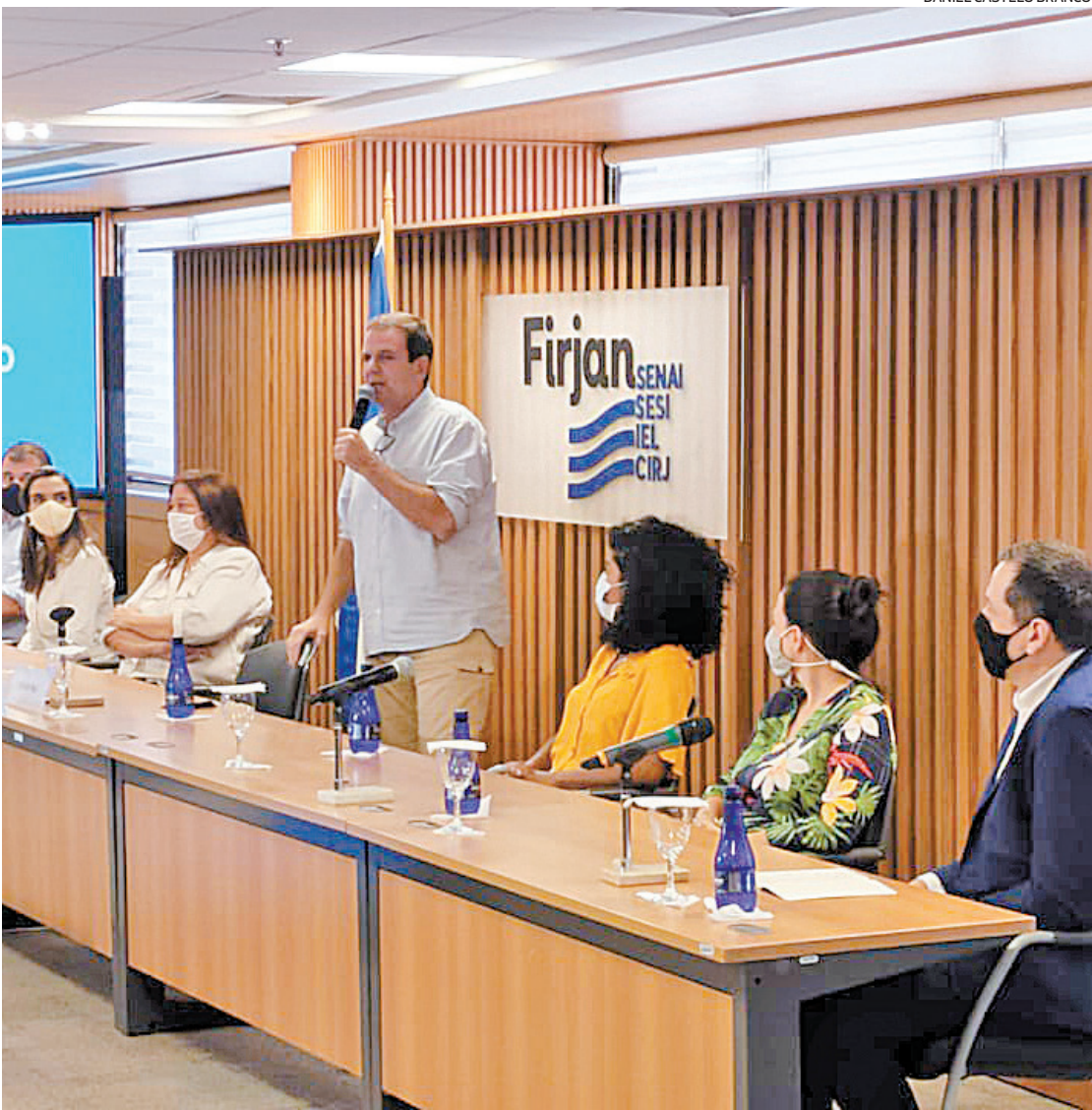
Eduardo Paes apresentando sua equipe durante coletiva: quatro mulheres entre os seis novos nomes