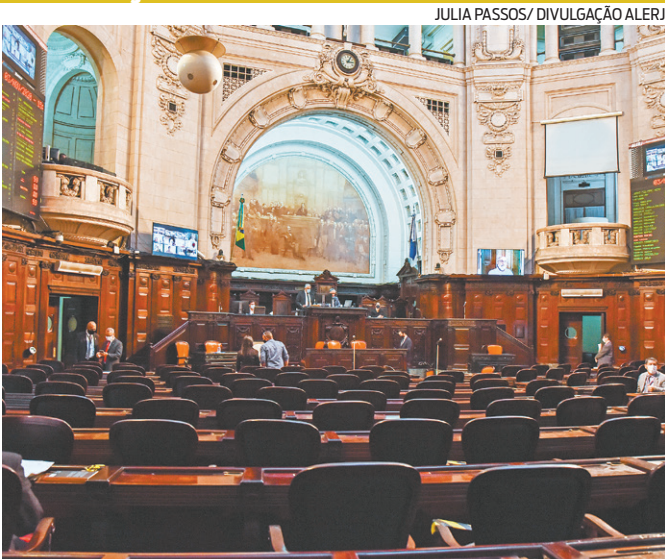
Reunião dos parlamentares para discutir emendas será às 13h