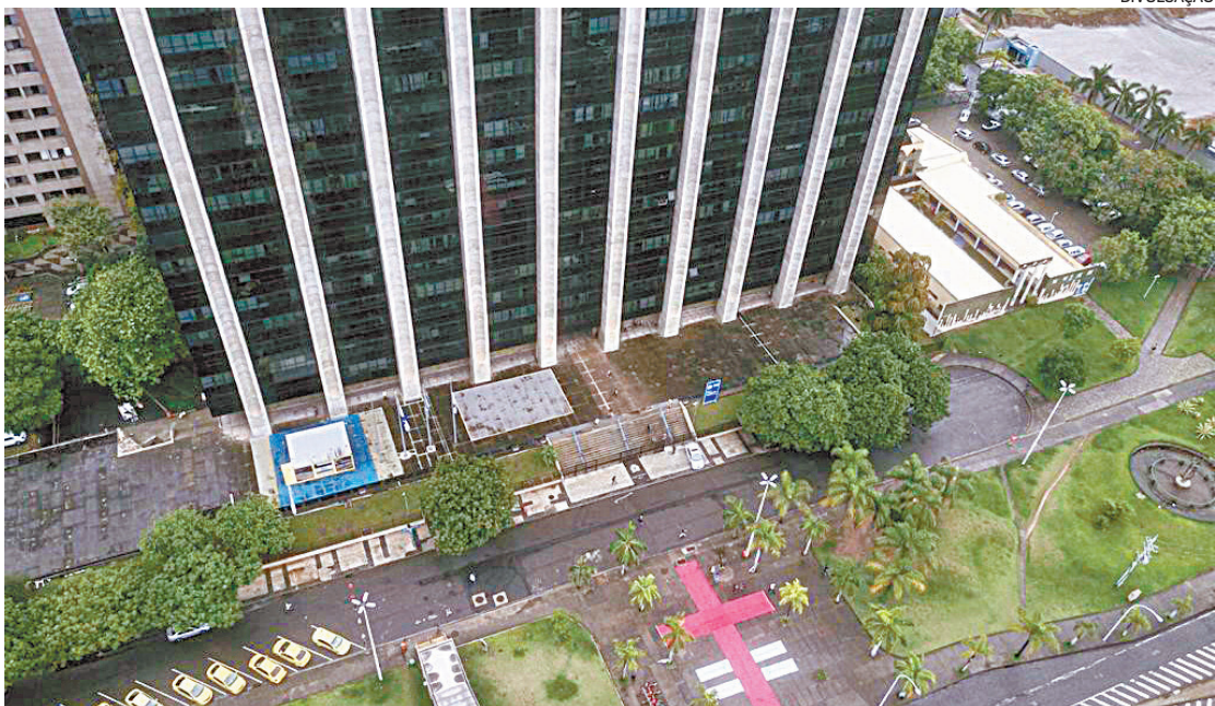
Em ato realizado em novembro, servidores da Educação cobraram o calendário de pagamento do 13º

A Fazenda, por sua vez, afirmou que “não se trata de operação de crédito”, mas que, “em razão da insegurança jurídica decorrente dessa divergência” e ao período de transição, “entendeu não ser mais oportuna a operação neste momento”.