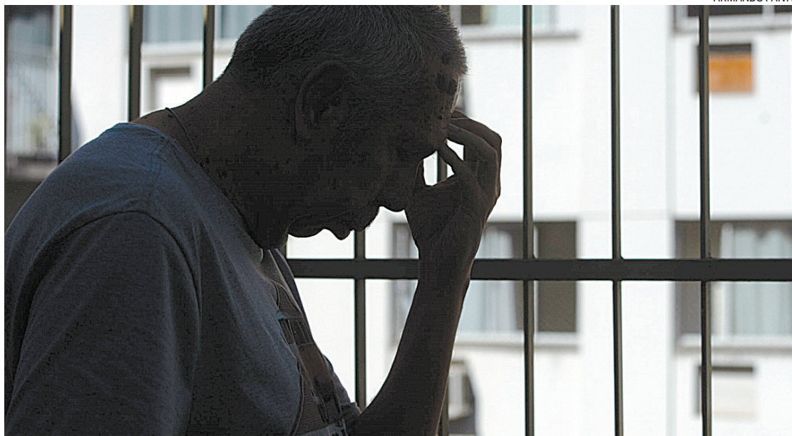
Aposentados esperam por um alívio no bolso com a entrada do 14º salário se Bolsonaro autorizar