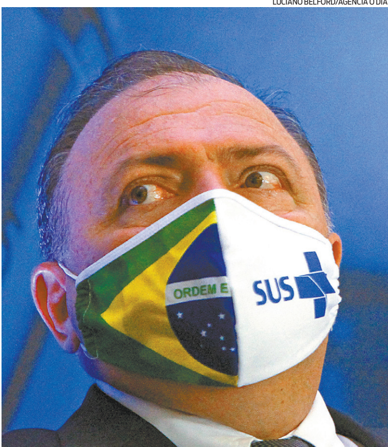
Ministro da Saúde Eduardo Pazuello está otimista.

APOIO AMPLO A iniciativa tem o apoio do Governo do Estado, a Associação Comercial do Rio de Janeiro (ACRJ) e os Sindicatos afiliados no interior em todas as 24 regiões de atuação da Federação. A intenção da instituição é reforçar, junto à população fluminense, a importância dos cuidados recomendados pela Organização Mundial da Saúde (OMS), como, por exemplo, uso de máscaras; limpeza das mãos com álcool; higienização dos ambientes fechados e de circulação; evitar aglomerações e manter o distanciamento social; e, dessa forma, contribuir para que não tenhamos que retroceder nas vitórias já alcançadas.