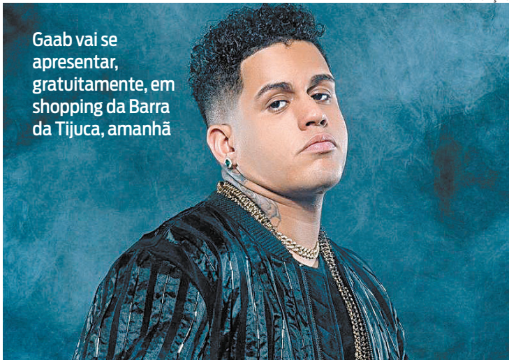
Gaab vai se apresentar, gratuitamente, em shopping da Barra da Tijuca, amanhã

O evento acontece das 11h às 17h na portaria 1. A visitação é gratuita. O estabelecimento comercial fica na Rua Fonseca 240, em Bangu. Mais informações: 2018-2321.