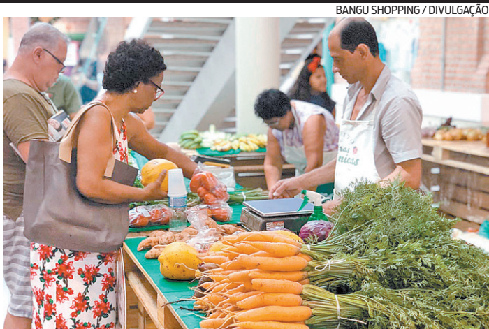
Desta vez, o evento vai contar com produtos para a ceia natalina

23 a 29/11, a três números, aumentando ainda mais as chances de ganhar. A promoção termina no dia 27. O sorteio será realizado pela Loteria Federal no dia 6 de janeiro de 2021 e o resultado divulgado no dia seguinte. Para mais informações, consulte o regulamento no site do Via Parque ( viaparqueshopping.com.br ).