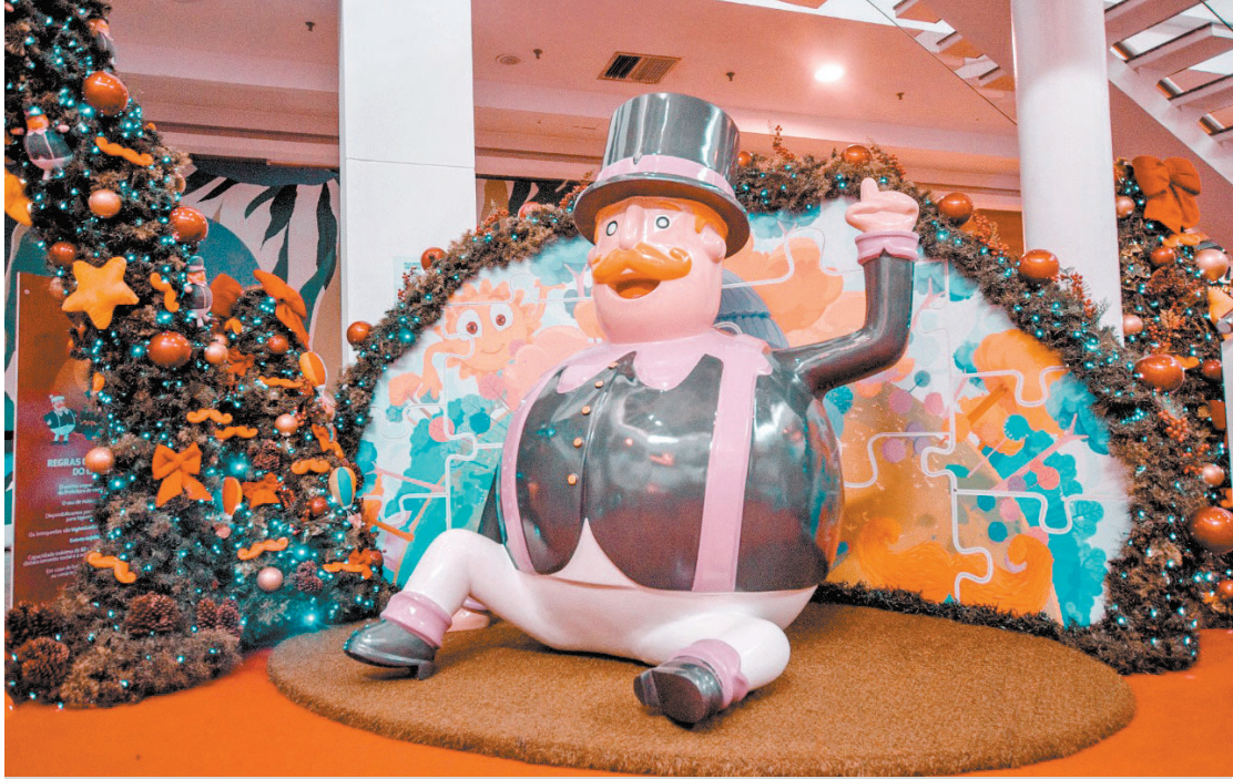
O Bita guia as crianças nas aventuras junto com os personagens Lila, Dan e Tito, com muita alegria

A árvore, símbolo mais emblemático do Natal, tem 12 metros de altura e está na Praça de Eventos, no 1º piso, com outras 20 árvores enfeitadas com miniaturas dos personagens, onde os visitantes podem contemplar cada detalhe de sua rica de-