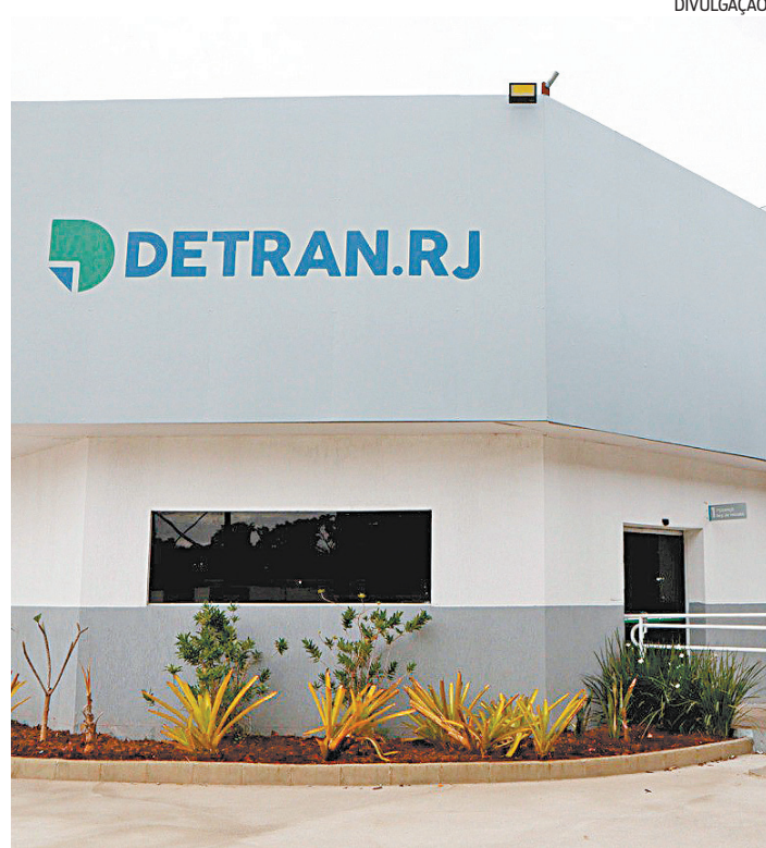
Mais oito unidades foram abertas, além das 12 já anunciadas

As unidades Araruama, Barra Mansa, Angra, Campos 2, Campo Grande e Miracema continuam fechadas para desinfecção porque funcionários testaram positivo para covid-19.