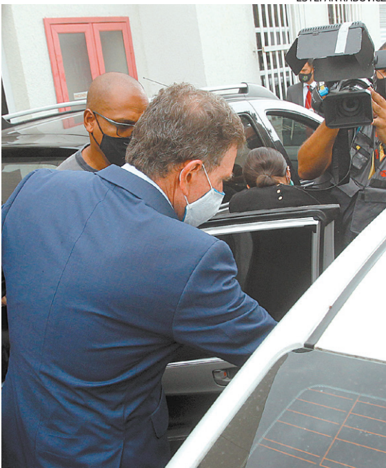
Na foto acima, Crivella deixa a Cidade da Polícia

G overnadores, prefeitos, autoridades... Se tá preso, onde é? No Rio de Janeiro! Corrupção tem em todos os lugares, mas aqui é cultural. Aqui é esquema montado, só para receber suas peças corruptas. A prisão do prefeito Marcelo Crivella, há menos de 10 dias de deixar o cargo, não é a sentença final. E a gente nem tá aqui pra realizar isso! Mas é o desenho desta cidade. Durante a campanha, há pouco tempo, num passado bem recente, Crivella bateu na corrupção... E fez até previsão! Afirmou que Eduardo Paes seria preso. Mas quem acertou mesmo foi o agora prefeito eleito. Mais um capítulo triste para a política do Rio. Mais um de um povo que não aguenta