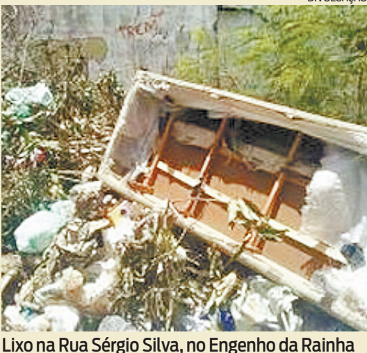
Lixo na Rua Sérgio Silva, no Engenho da Rainha

■ Sabe o que a gente tem que ficar de olho diante dessa prisão do prefeito? É isso se tornar uma desculpa para não pagar mais o servidor do município! Os funcionários, como alguns professores, sequer receberam o 13º salário. Tem servidor que se duvidar não vai ter nem o que comer na ceia de amanhã! Que isso não se torne mais um motivo para atrasar pagamento do trabalhador. Porque é sempre assim... Nesses 4 anos foram inúmeras as desculpas esfarrapadas pra tudo... Sempre arrumam uma maneira de justificar os seus fracassos. Bora colocar o Pingo no I... Tem que acabar com isso da corda sempre arrebentar pro lado mais fraco!