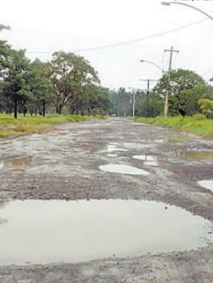
Buracos viram verdadeiras piscinas em dia de chuva