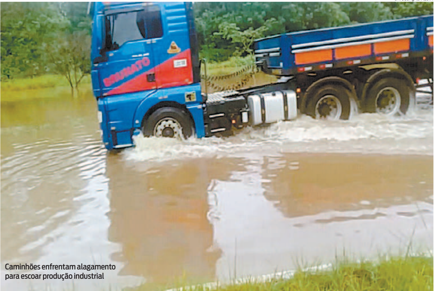
Caminhões enfrentam alagamento para escoar produção industrial