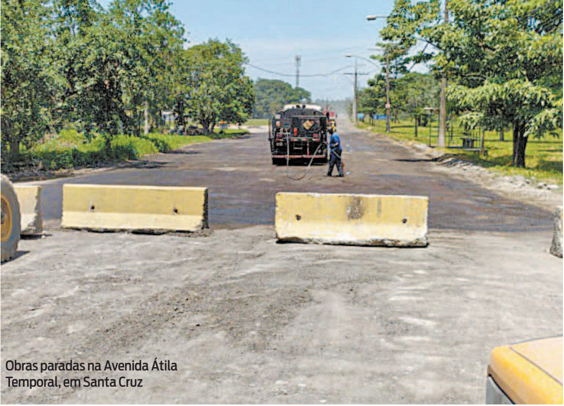
Obras paradas na Avenida Átila Temporal, em Santa Cruz

e Paciência, quatro; segundo informações da Companhia Industrial do Estado do Rio de Janeiro (Codin), responsável por implantar os distritos. A sua manutenção é, constitucionalmente, feita pelas prefeituras dos municípios. No polo de Santa Cruz, por exemplo, cada vez que chove é uma “emoção”. A chuva cria, inclusive, verdadeiros lagos. É possível ver pássaros se banhando na água suja que fica acumulada. Em uma das visitas que a reportagem de O DIA fez ao local, máquinas da Prefeitura do Rio surgiram, mas desapareceram na semana seguinte. Os buracos, no entanto, permaneceram. Após muita cobrança e inúmeras denúncias, a prefeitura começou a recapear a via principal no último dia 6. Mas o problema não foi resolvido. O próprio secretário de Infraestrutura, Sebastião Bruno, admitiu durante reunião com representantes das indústrias na Associação de Empresas do Distrito Industrial (Aedin), que a medida era paliativa. Máquinas foram colocadas no local, mas a obra não avançou. É importante destacar que as intervenções nos distritos devem abranger, além do pavimento asfáltico, recupe-