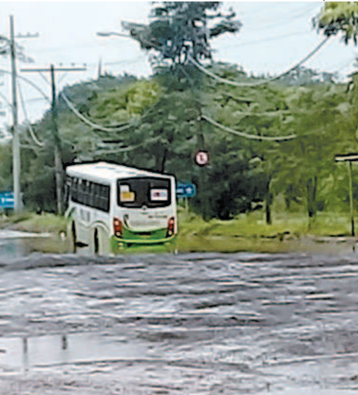
Condições precárias nas ruas do Distrito Industrial de Santa Cruz