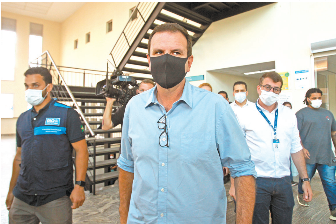
Eduardo Paes admitiu ontem que o pagamento de dezembro no 5º dia útil, amanhã, não está garantido

Os trabalhos agora serão para reequilibrar as contas e conseguir quitar os próximos vencimentos em dia, o que também, segundo alguns governistas, inicialmente será difícil. E a retomada do calendário de pagamento no segundo dia útil não é vista como viável para esse primeiro semestre enquanto não houver incremento de receita no caixa.