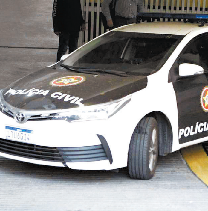
Polícia Civil autuou a agressora pelo crime de lesão corporal

lher e a prendeu. O nome da agressora não foi divulgado. As investigações revelaram que a filha consumiu duas garrafas de vinho e, descontrolada, deu chutes e socos na mãe, que provocou lesões no braço e no rosto. A vítima chegou a pedir ajuda para vizinhos, ainda ensanguentada. A agressora foi autuada pelo crime de lesão corporal com base na Lei de Violência Doméstica e com aumento de pena em razão da idade avançada da idosa.