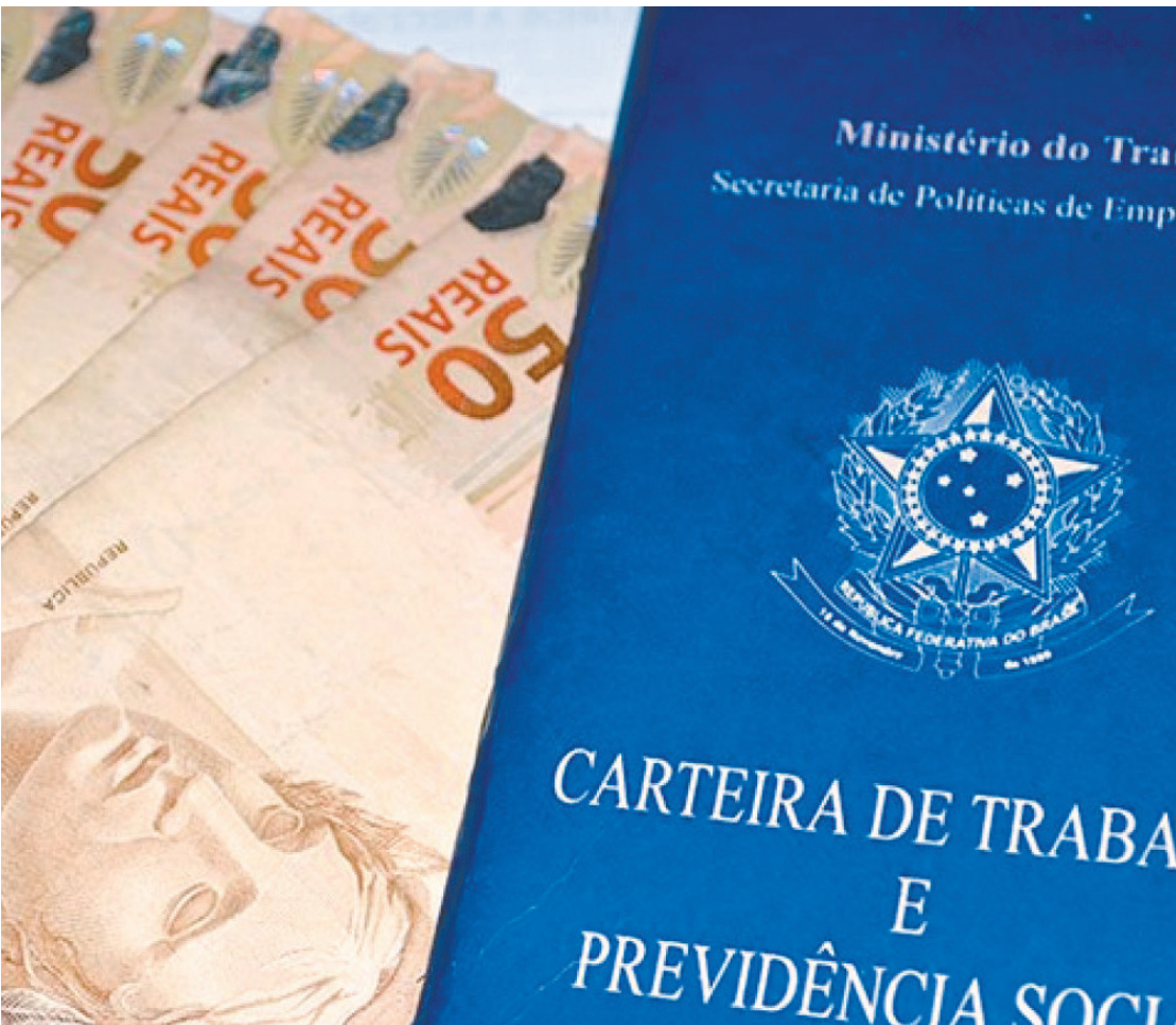
Especialistas avaliam que o 1º semestre será difícil. O fim do auxílio emergencial terá impacto em janeiro