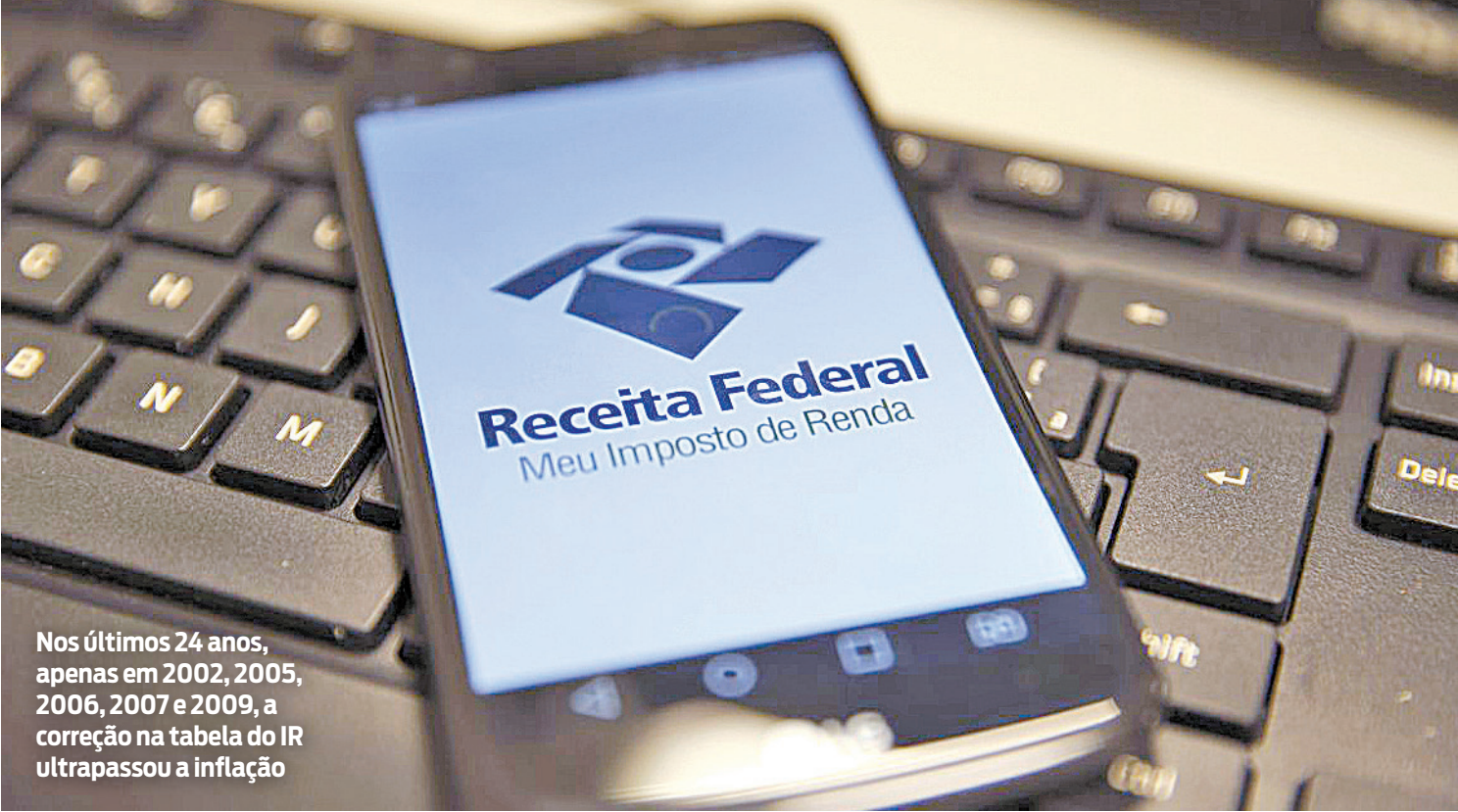
Nos últimos 24 anos, apenas em 2002, 2005, 2006, 2007 e 2009, a correção na tabela do IR ultrapassou a inflação

na carga tributária, o contribuinte vai pagar mais pelo imposto, em comparação ao ano anterior. Atualmente, todos os contribuintes com renda tributável superior a R$ 1.903,98 pagam o Imposto de Renda. Se a tabela fosse corrigida,