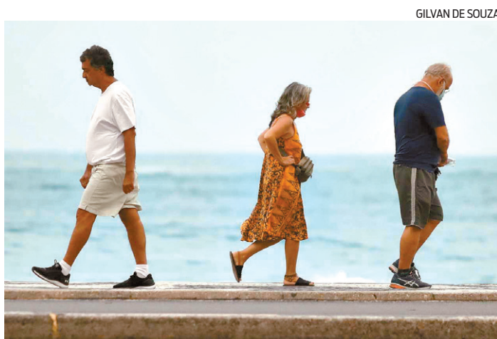
Videoaulas da SMESQV serão fornecidas pelo WhatsApp

“A busca por hábitos cada vez mais saudáveis na terceira idade vem crescendo e com isso, o objetivo da secretaria com o ‘nova.idade’, é melhorar a qualidade de