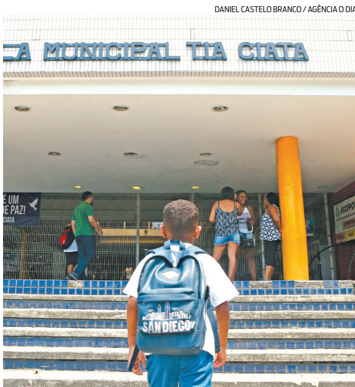
Aluno sobe a entrada da Escola Municipal Tia Ciata, no Centro

Para realizar a transferência de alunos da rede particular ou outros entes federativos para a Rede Municipal do Rio de Janeiro dos alunos da Pré-escola, do Ensino Fundamental e da Educação de Jovens e Adultos basta acessar o site www.matricula.rio e realizar a escolha da opção que melhor lhe atenda den-