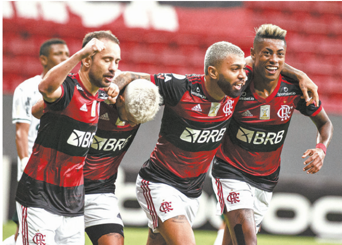
O Flamengo venceu o Palmeiras, na quinta-feira, em Brasília