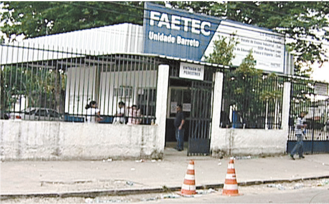
Processo seletivo para a Faetec: as inscrições podem ser feitas no site: www.faetec.rj.gov.br

Entre os cursos técnicos gratuitos oferecidos pela rede estão: Administração, Análises Clínicas, Construção Naval, Eletrônica, Eletrotécnica, Enfermagem, Informática, Programação de Jogos Digitais, Rede de Computadores, Segurança do Trabalho, Telecomunicações, entre outros.