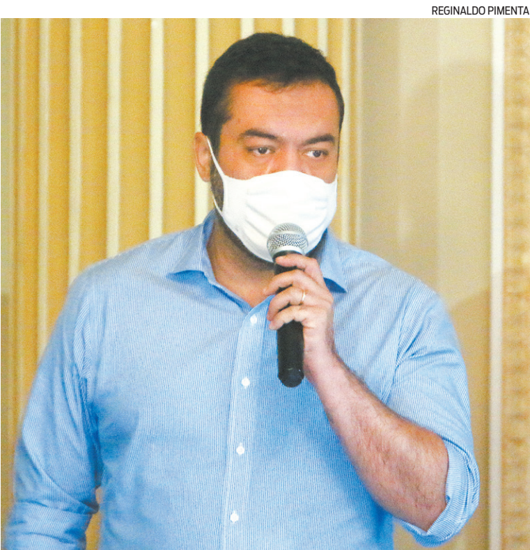
Cláudio Castro quer tentar deixar problemas no passado.

O governador Cláudio Castro partiu para o ataque e escreveu: “Juntos conseguimos construir resultados, reposicionar o estado e enfrentar melhor os desafios na reconstrução do Rio de Janeiro. O diálogo nos permite envolver o RJ em uma série de ações positivas para criar um ambiente de negócios favorável ao investimento. A união entre setor privado e o poder público fortalece o alinhamento na criação de iniciativas para fomentar a economia fluminense”. Agindo assim, pensa Castro, os problemas ficarão no passado e, quando a economia voltar, o Rio estará num patamar melhor.