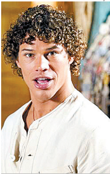
FLOR DO CARIBE 18h30 | GLOBO | Livre

■ Candinho presenteia Taís com uma flor. Veridiana observa Taís com Candinho. Veridiana percebe o interesse de Taís por Candinho. Guiomar pede o contato de Muniz para Ester. Manolo conta a Samuel sobre seu encontro com Dionísio.