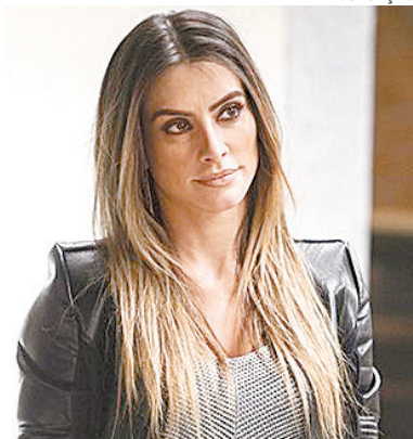
HAJA CORAÇÃO 19h30 | GLOBO | 12 anos

■ Candinho presenteia Taís com uma flor. Veridiana observa Taís com Candinho. Veridiana percebe o interesse de Taís por Candinho. Guiomar pede o contato de Muniz para Ester. Manolo conta a Samuel sobre seu encontro com Dionísio.