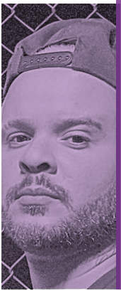
Hitmaker: o trio que está lançando single próprio, estreando como cantores (abaixo, com Lexa)

gou’, de Ludmilla, entre outros sucessos de Lexa, Luísa Sonza e até de representantes de outros ritmos, como Léo Santana e Gustavo Mioto. Mas afinal, o que faz o trabalho dos três cariocas tão reconhecido no cenário musical? “Diversidade. Nós três temos origens, criações e musicalidades totalmente distintas. Acreditamos que a união dessas personalidades constrói uma identidade única que potencializa a identificação de muitas pessoas”, defende o músico, que celebra a boa fase e mostra resiliência frente ao novo momento do grupo. “Viver de música no Brasil é uma conquista tremenda, conseguir isso emocionando milhares de pessoas foi uma grande realização pra nós. Adoramos desafios, isso que nos move, esse frio na barriga do próximo obstáculo é essencial pra não se tornar estático”, pondera.