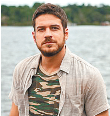
A FORÇA DO QUERER 21h30 | GLOBO | 14 anos

■ Tamara pede desculpas a Apolo. Shirlei aconselha Tancinha. Bruna se desespera ao saber que Camila está viva. O médico avisa a Aparício que Camila sofreu traumatismo craniano. Henrique diz que Carmela nunca será modelo.