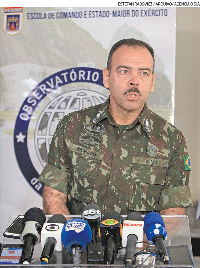
General Richard Nunes já foi Secretário de Segurança Pública do Rio.

O ministério da Defesa divulgou nota de esclarecimento: “As Forças Armadas mantiveram, em 2020, o mesmo patamar de gastos com gêneros alimentícios de 2019, conforme dados do SIAFI, mesmo com um aumento de cerca de 14% no valor dos alimentos no mesmo período (IPC-FGV). Tais gastos, conforme já esclarecido anteriormente, constituem obrigação prevista em lei, sendo destinados à alimentação de um efetivo de 370 mil militares da ativa, em 1.600 organizações militares por todo o País. Ao contrário dos civis, os militares não recebem qualquer auxílio alimentação”.