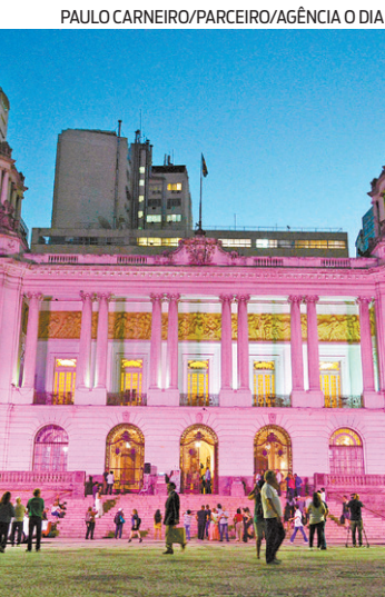
Câmara Municipal do Rio