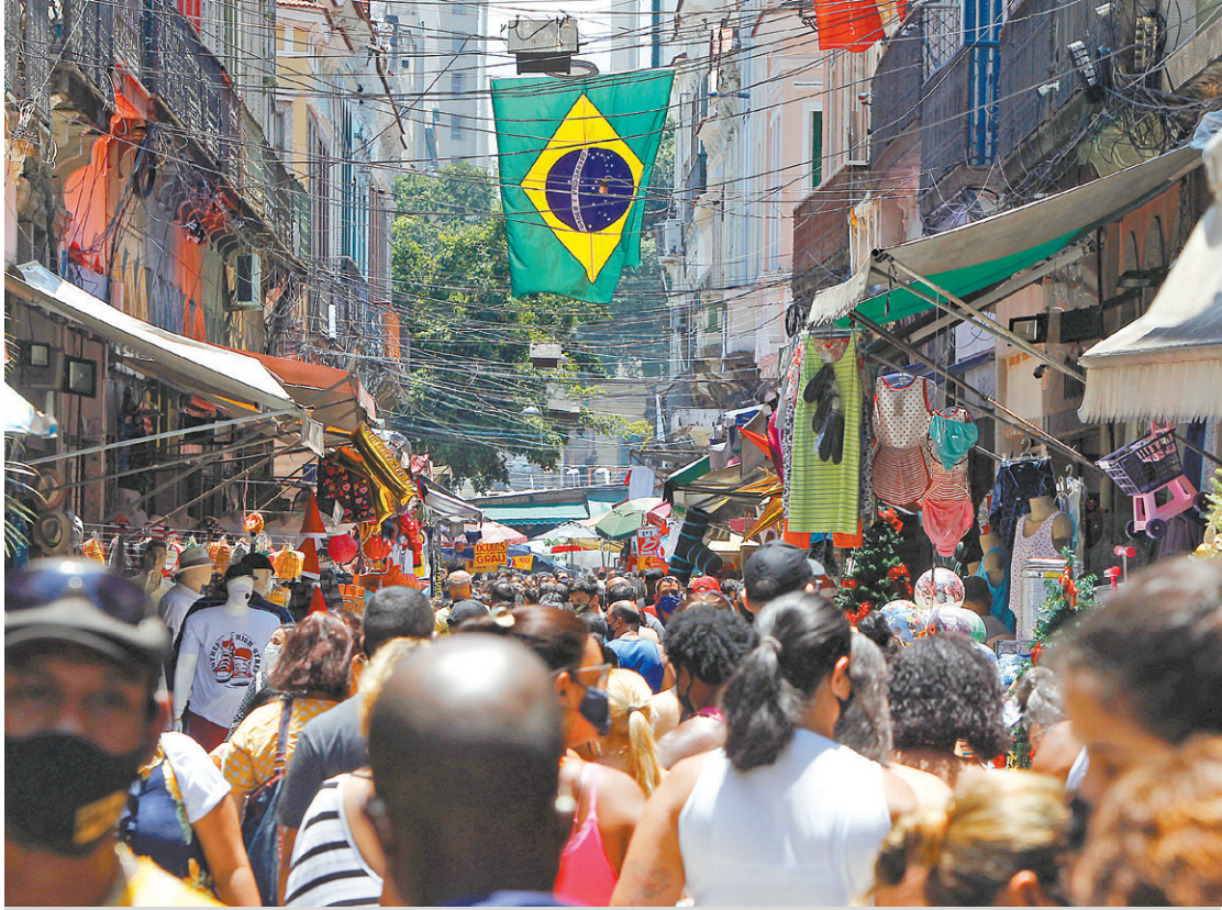
Saara poderá funcionar durante o período do feriado de Carnaval, bem como outros lugares