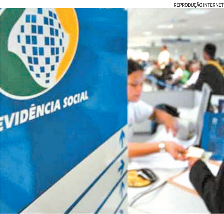
Para quem está dentro dos critérios, o aumento é de 5,45%

este ano. Para quem recebe acima de um salário mínimo, o aumento é de 5,45%. Confira abaixo o calendário de pagamentos do INSS de acordo com o final do benefício excluindo o dígito.