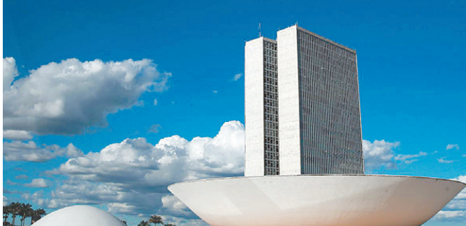
Projeto que prevê a medida tramita no Parlamento, em Brasília