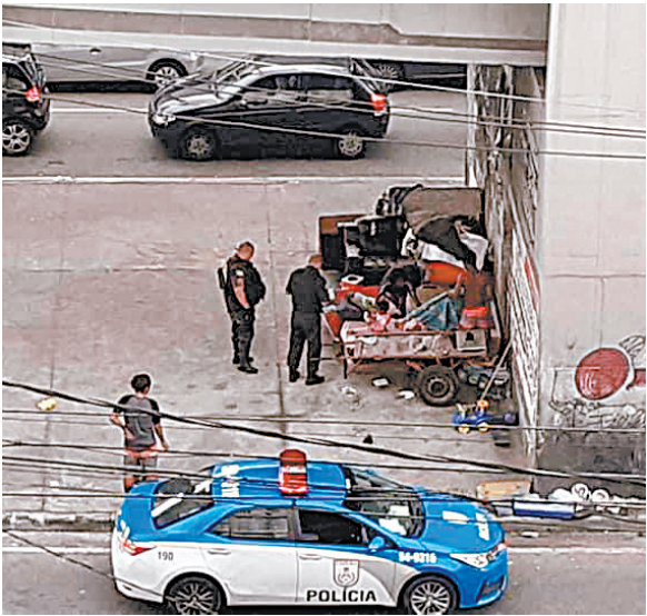
Policiais levam alimentos e brinquedos para família

Policiais parados embaixo do viaduto Negrão de Lima, na extensão do BRT, levando alimentos e brinquedos para uma criança de um pouco mais de um ano de idade, que vive com sua família em meio a entulho, móveis e até uma carrocinha