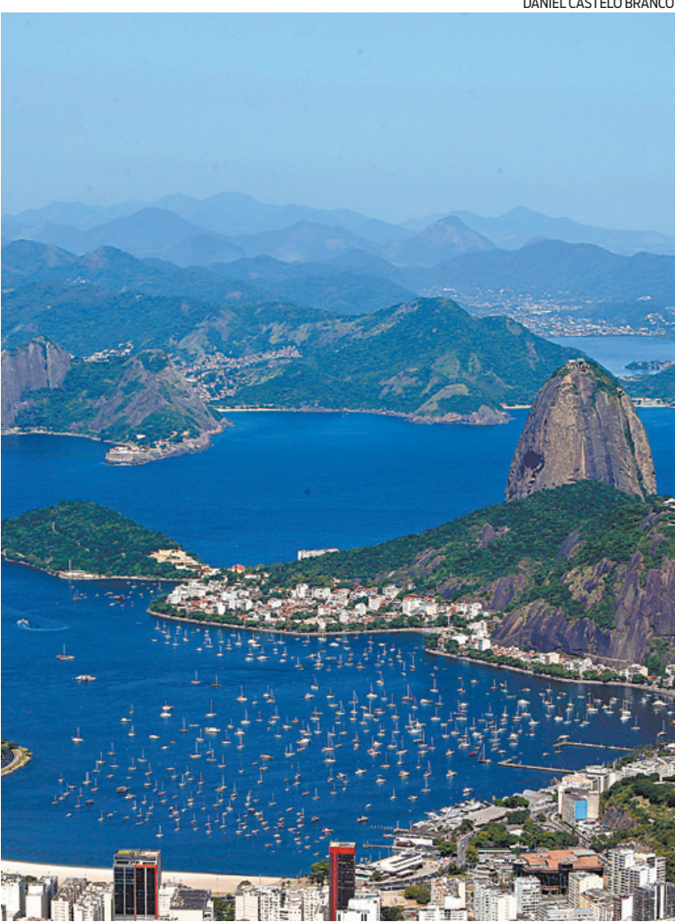
Pesquisa mostra que o Rio de Janeiro está perdendo espaço

Um estudo da Macroplan - Desafios da Gestão Municipal (DGM) 2021 - aponta que o Rio de Janeiro é a pior capital do sudeste do país. O levantamento analisou a qualidade dos serviços essenciais entregues à população nas 100 maiores cidades do Brasil. As primeiras colocações da região ficaram com Vitória (1º), Belo Horizonte (2º) e São Paulo (3º). A Segurança Pública foi a área com melhor qualificação da capital fluminense, ficando na 12ª colocação. Em Saneamento e Sustentabilidade, a cidade ocupa a 32ª posição, ganhando 8 posições em um ano. No ranking de Educação, o Rio ficou em 44ª colocação, após perder duas posições na comparação com o ano anterior. Na Saúde, o município ocupa, atualmente, a 67ª colocação entre os analisados, tendo recuado 5 posições, em relação ao ranking do ano anterior desta área. O desafio da Cidade Maravilhosa é acelerar o ritmo dos avanços. “Outros municípios estão melhorando em um ritmo mais acelerado do que o Rio de Janeiro”, explica a economista sênior Adriana Fontes, coordenadora do DGM. DESAFIOS DA GESTÃO MUNICIPAL O levantamento avalia, desde 2013, a evolução dos serviços essenciais nas grandes cidades brasileiras sob a influência das prefeituras - mesmo que fornecidos por outros entes públicos ou pela iniciativa privada. Os 100 municípios analisados pela Macroplan representam metade do PIB brasileiro e concentram 39,3% da população do país.