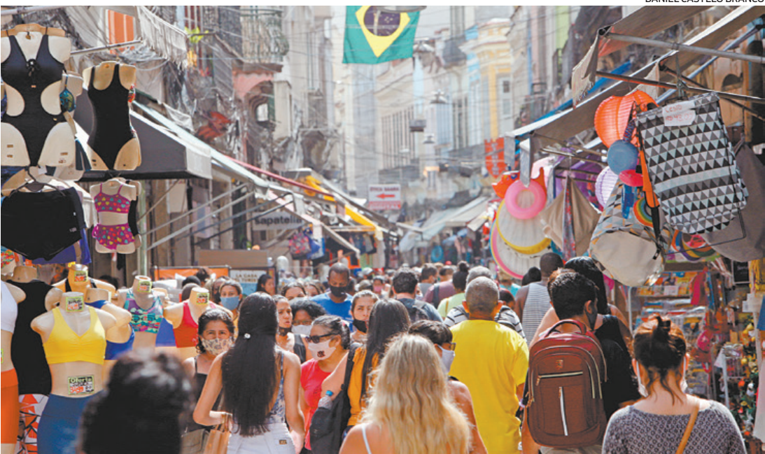
Acordo entre Sindicato dos Trabalhadores e Fecomércio possibilita abertura de lojas em todo estado

Neste ano, em razão da pandemia, o Carnaval foi cancelado. A semana que costuma ser de feriado e folia para muitos trabalhadores será bem diferente da habitual. De acordo com decreto do governo do Rio de Janeiro, a terça-feira gorda segue como feriado. Entretanto, um acordo entre a Fecomércio-RJ e o Sindicato dos Trabalhadores possibilita a abertura das lojas em todo o estado, inclusive na terça e na Quarta-Feira de Cinzas. O acordo não obriga a abertura das lojas, sendo uma decisão facultativa. “Trata-se de um pleito da Federação que beneficiará os comerciantes de toda a cidade em um período atípico. O feriado foi mantido, mas as autoridades anunciaram que não vão permitir comemorações oficiais da data, como desfiles de escolas de samba e blocos de rua, por conta da pandemia”, explica Antonio Florencio de Queiroz Junior, presidente da Fecomércio-RJ. “Esperamos que a medida contribua para o aumento das vendas e dê a todos o fôlego necessário para o setor voltar a crescer”, finalizou ele. Na terça-feira, os trens da SuperVia vão circular de acordo com a grade de sába-