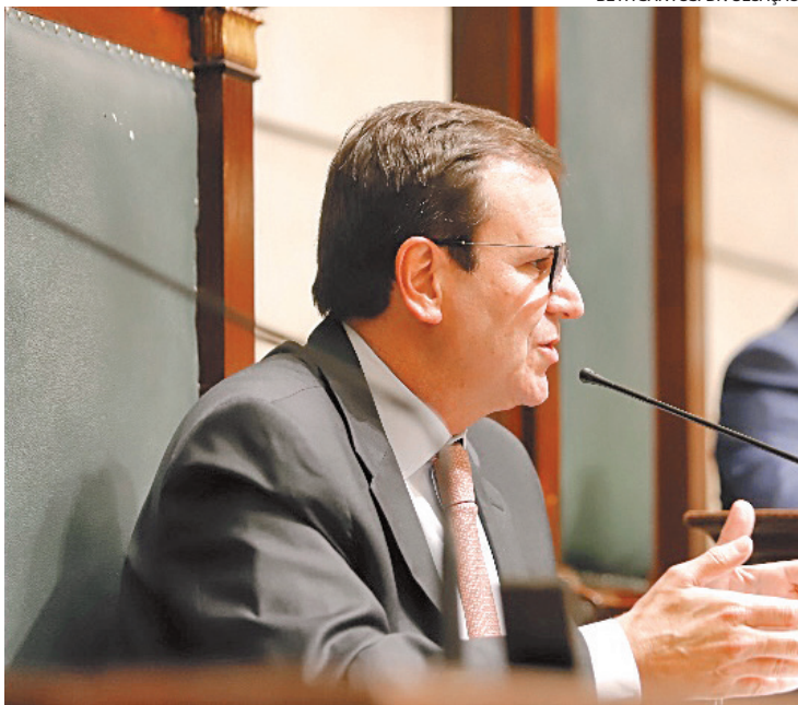
Paes participou da abertura do ano legislativo na Câmara Municipal

Fato é que a área técnica da prefeitura já trabalha com essa hipótese, tendo em vista a determinação da Emenda Constitucional 103/19, que instituiu a Reforma da Previdência no país. Além disso, um novo plano de capitalização do Funprevi e a criação de previdência complementar para quem ganha acima do teto do INSS (R$ 6.433,57) são outros itens que o governo deve propor.