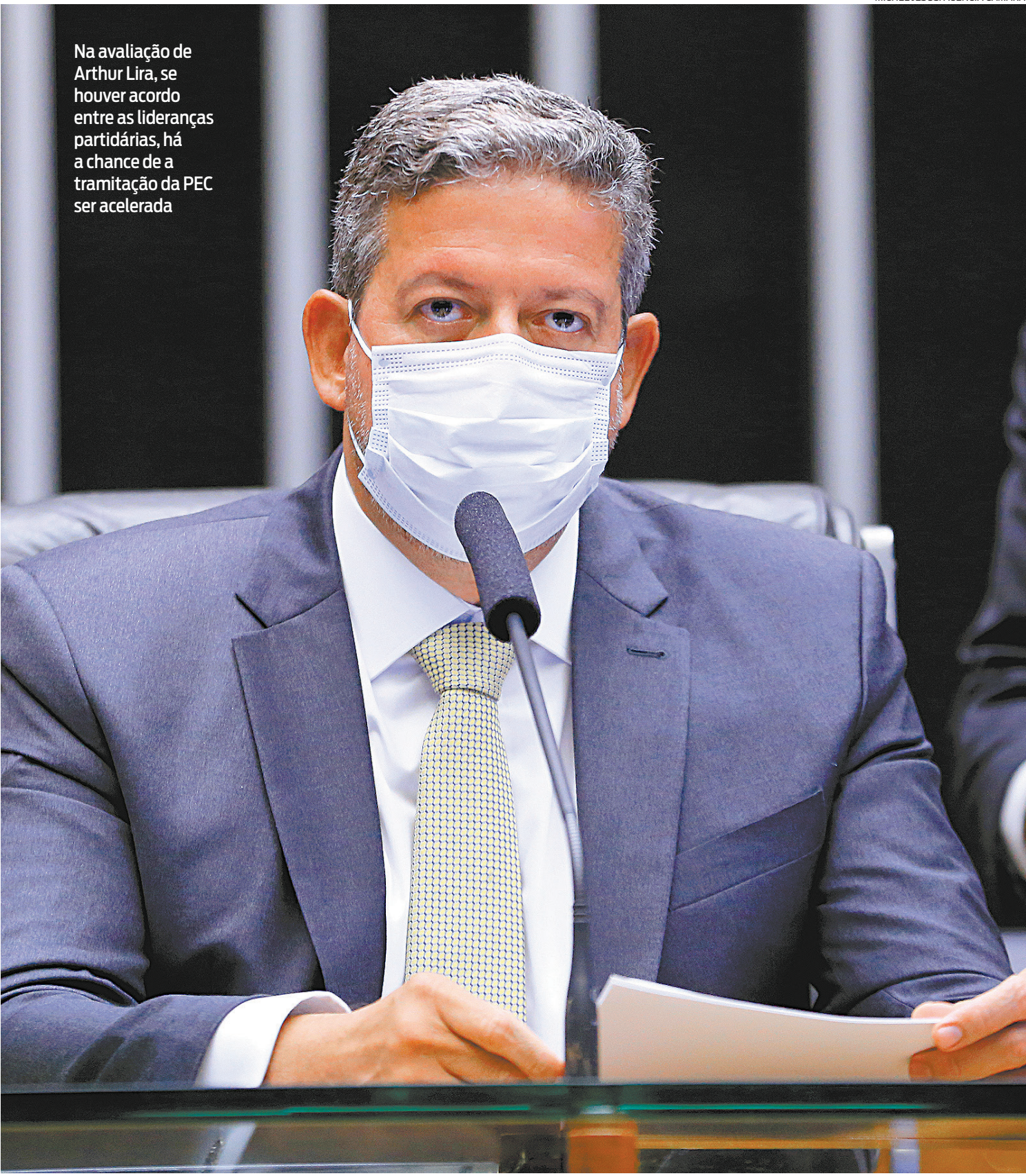
Na avaliação de Arthur Lira, se houver acordo entre as lideranças partidárias, há a chance de a tramitação da PEC ser acelerada

Os deputados e deputadas, tendo conhecimento do texto, pelo menos dá para os partidos e as lideranças se posicionarem com relação ao mérito a partir da terça-feira” ARTHUR LIRA, presidente da Câmara