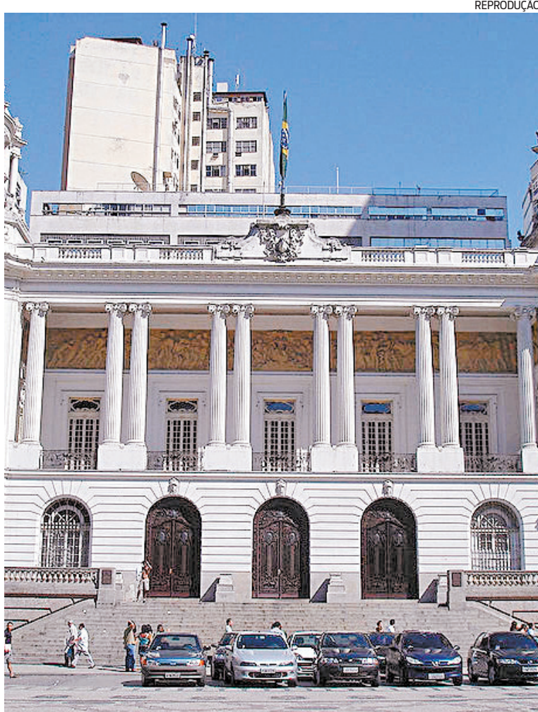
Este ano, a prefeitura colocou à disposição da Câmara 23 servidores

Já no Legislativo, surge outro problema. Muitos assessores “vips” não trabalham, mas segundo se comenta, recebem religiosamente em dia. Os beneficiários de cargos comissionados iniciam ganhando R$ 1.378 e podem vir a ganhar até R$ 3.021. A média salarial para cargo comissionado no país é de R$ 2 mil. A formação mais comum é de graduação em administração. No mínimo, cada gabinete conta com três funcionários comissionados - sendo um chefe de gabinete e dois assessores parlamentares. Atualmente, são quatro funcionários - um chefe de gabinete e três assessores.