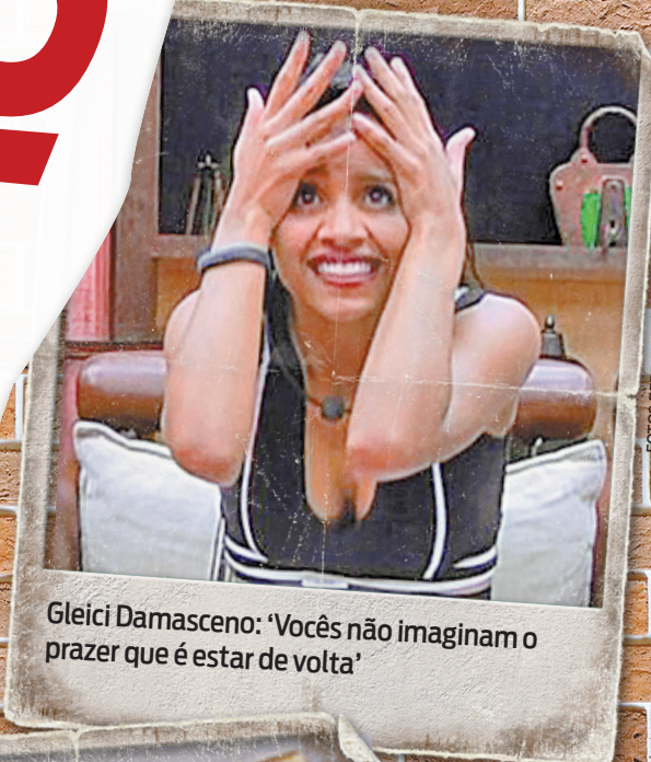
Gleici Damasceno: ‘Vocês não imaginam o prazer que é estar de volta’