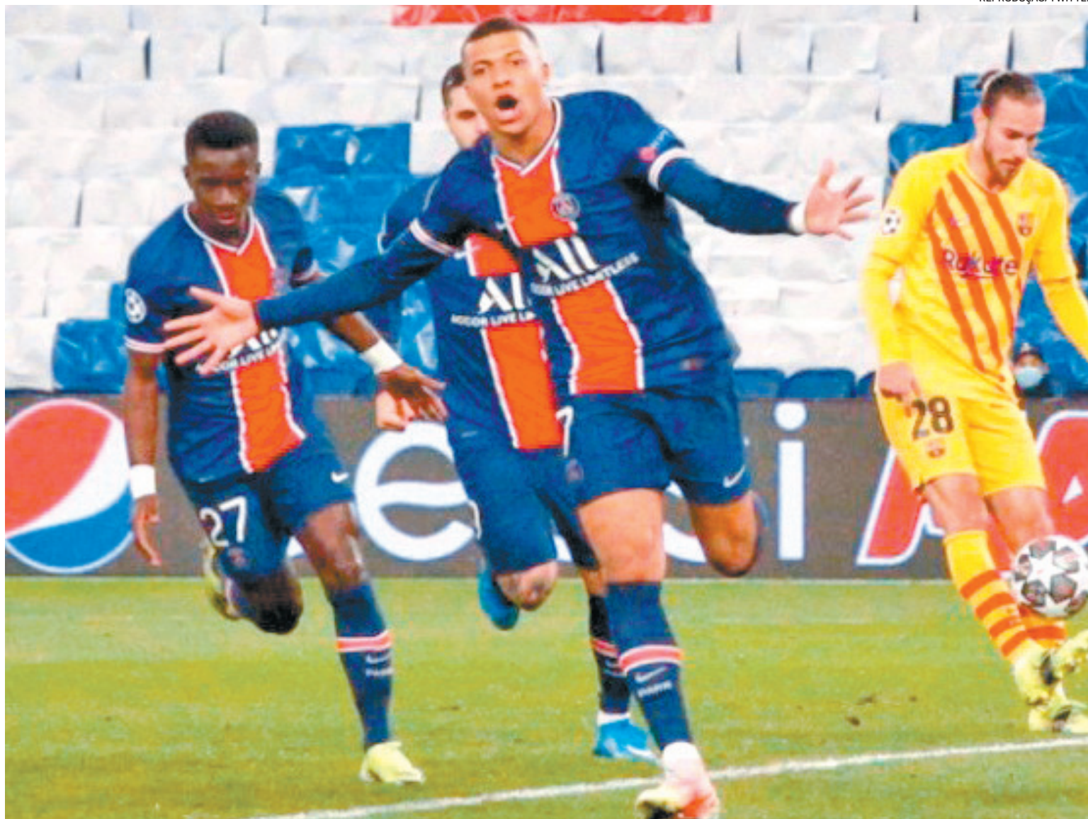
Mbappé vibra após marcar o gol do PSG, no Parque dos Príncipes, e manter o time francês sonhando com a conquista do inédito título europeu

A vaga do Liverpool foi assegurada ontem também, após o time inglês bater o RB Leipzig, por 2 a 0, com gols de Salah e Mané, na Puskas Arena, repetindo o placar do primeiro