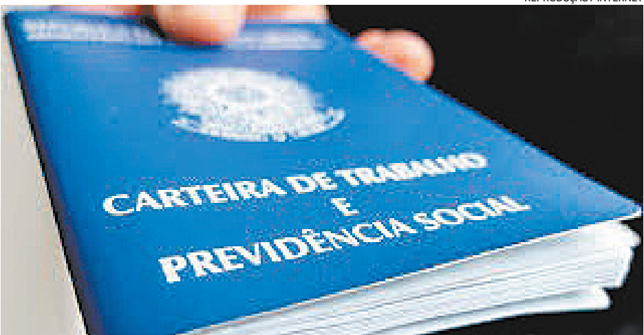
REPRODUÇÃO / INTERNET

semprego para poupar recursos do FAT e conseguir direcioná-los ao benefício emergencial. O programa que permite acordos para proteger empregos e aliviar o caixa das empresas vai durar quatro meses. Um desenho inicial previa que o governo bancaria com recursos públicos os primeiros dois meses de benefício, e os outros dois seriam antecipação do seguro-desemprego. No entanto, o governo mudou a estratégia e decidiu bancar integralmente os benefícios de quem tiver jornada e salário reduzido ou contrato suspenso, sem interferir no seguro-desemprego do trabalhador, que manterá o direito de forma integral caso seja demitido após o fim do acordo. O dinheiro sairá todo do FAT, mas sem necessidade