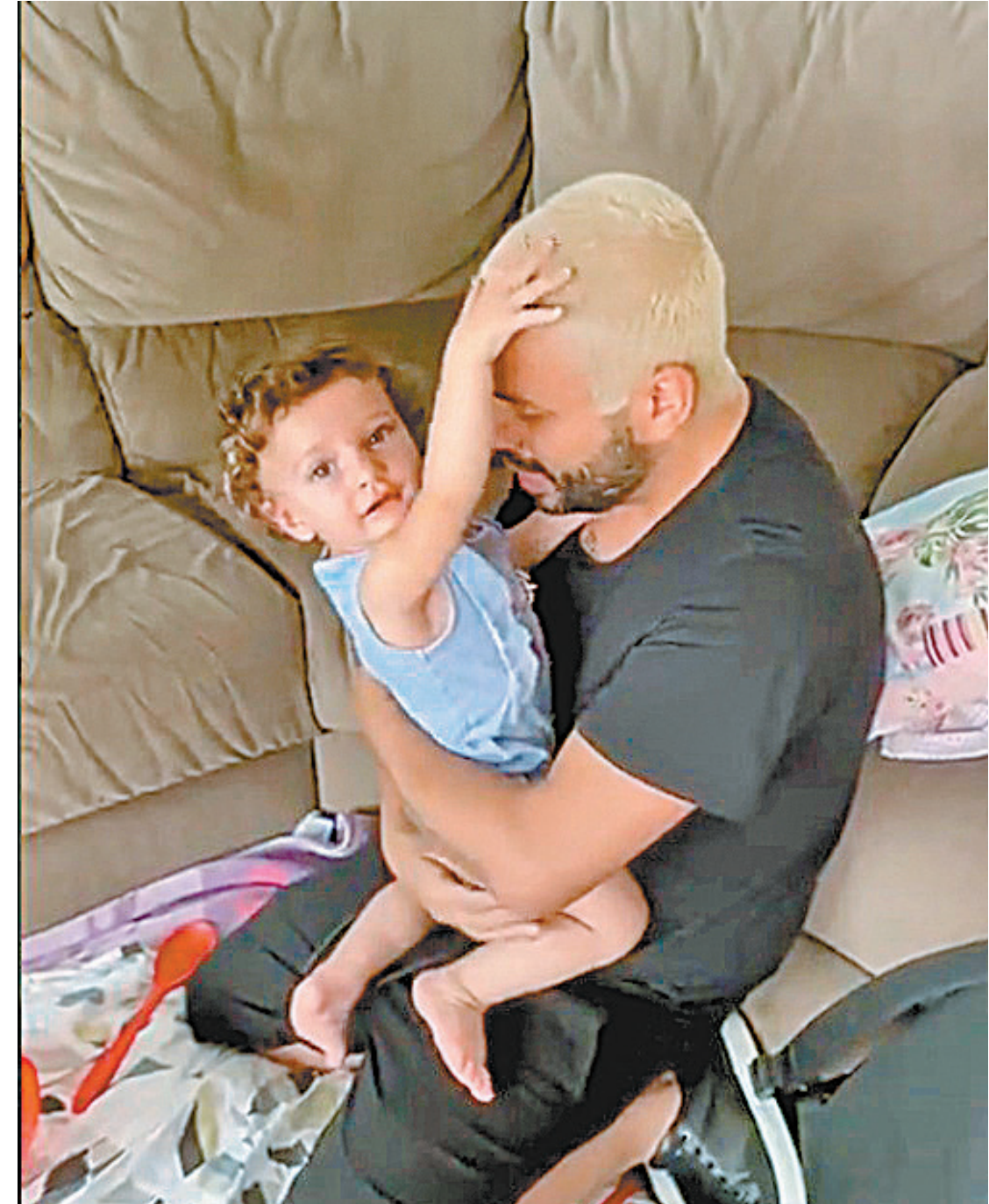
REPRODUÇÃO DE VÍDEO