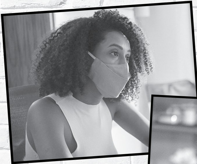
Larissa Manoela, protagonista de 'Além da Ilusão', e cena de 'Nos Tempos do Imperador': gravações suspensas

AMOR DE MÃE ▶ 21h30 | GLOBO | 14 anos ■ Ao ligar para Raul, Álvaro faz ameaças a Sandro. Érica chama a atenção de Verena (Maria) a respeito dos crimes que Álvaro cometeu ao se passar por ela.