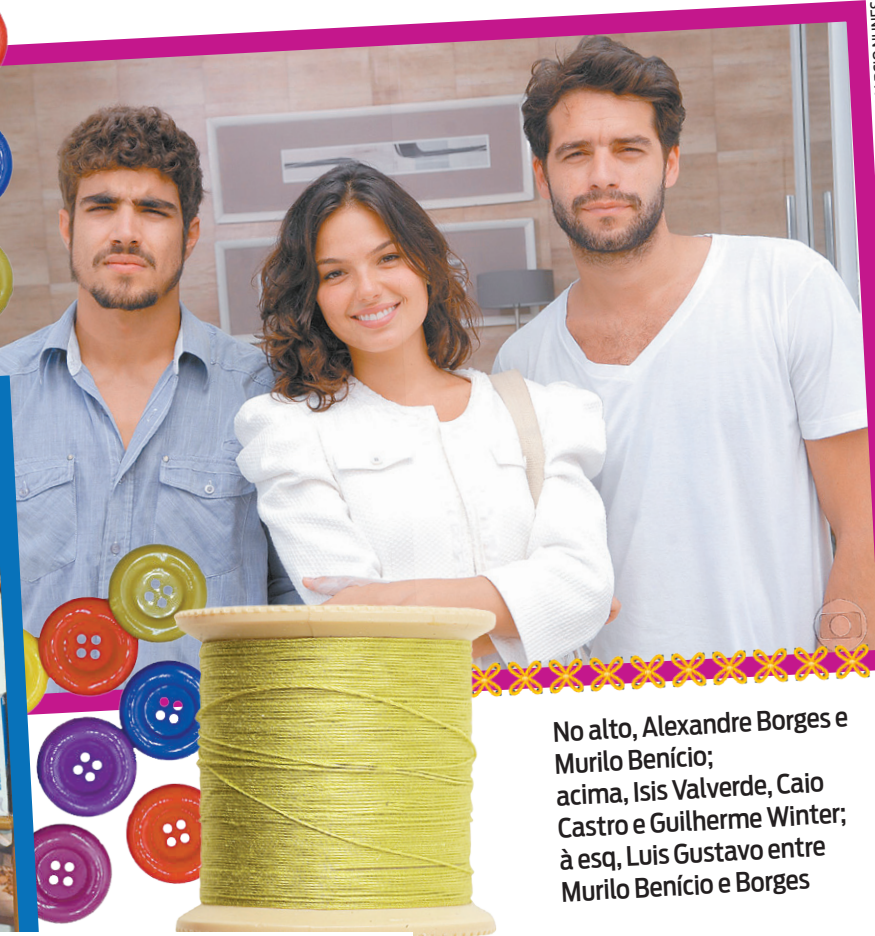
No alto, Alexandre Borges e Murilo Benício; acima, Isis Valverde, Caio Castro e Guilherme Winter; à esq, Luis Gustavo entre Murilo Benício e Borges