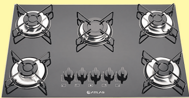
Foto refere-se ao modelo 5 queimadores

Nos meses de dezembro, de 2020 e janeiro de 2021, as mortes também ultrapassaram os nascimentos. Em fevereiro, o estado começou a registrar uma diminuição na diferença entre nascimentos e óbitos, com 12.591 óbitos e 14.178 nascimentos.