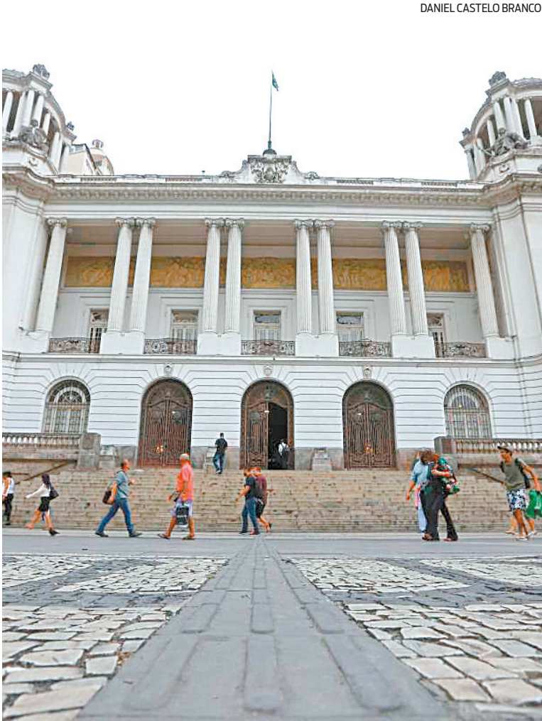
Vereadores do Rio votaram pela reforma da previdência de servidores.