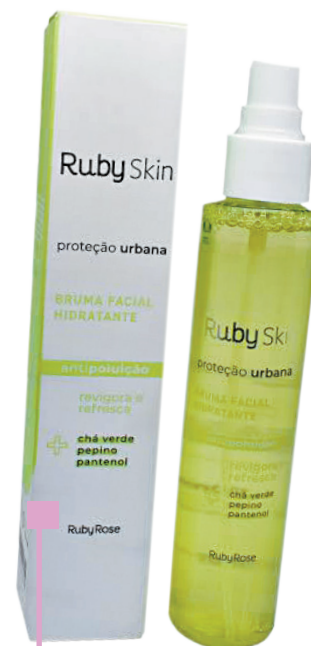
Bruma Facial Ruby Rose - A partir de R$ 19,90