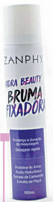
Bruma Facial Zanphy - A partir de R$ 21,90