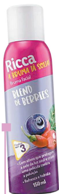
Bruma Facial Ricca - A partir de R$ 19,90