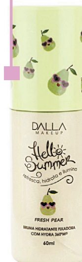
Bruma Facil Dalla Makeup - A partir de R$ 19,90