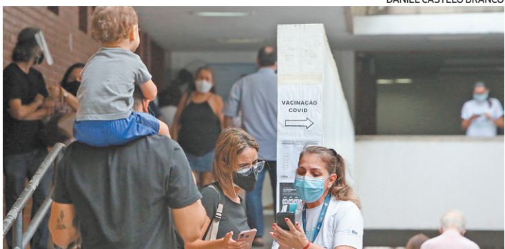
Vacinação contra gripe e covid no posto Heitor Beltrão, na Tijuca

Começou ontem a vacinação contra a gripe do primeiro grupo prioritário divulgado pela Secretaria Estadual de Saúde no Rio de Janeiro. A campanha foi dividida em três fases e a distribuição de doses será feita primeiramente para trabalhadores da saúde, crianças entre seis meses e seis anos de idade, gestantes, puérperas (mães que deram à luz recentemente