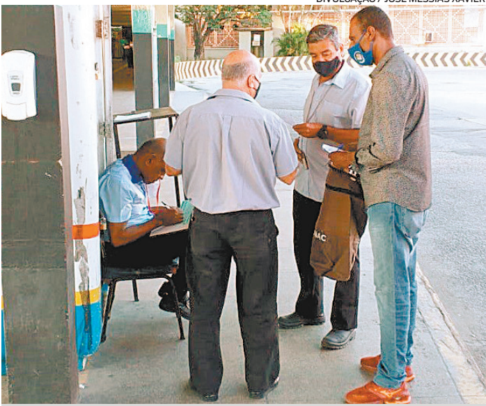
Diretores do Sintronac coletaram votos em Niterói

para oferecer uma educação de qualidade para cada aluno da rede. Sabemos que nossas crianças precisam da escola para aprender e se desenvolver. Além do mais, para a maioria delas, a escola com as medidas sanitárias adequadas é o lugar mais seguro que elas podem ter”, ressaltou o secretário.