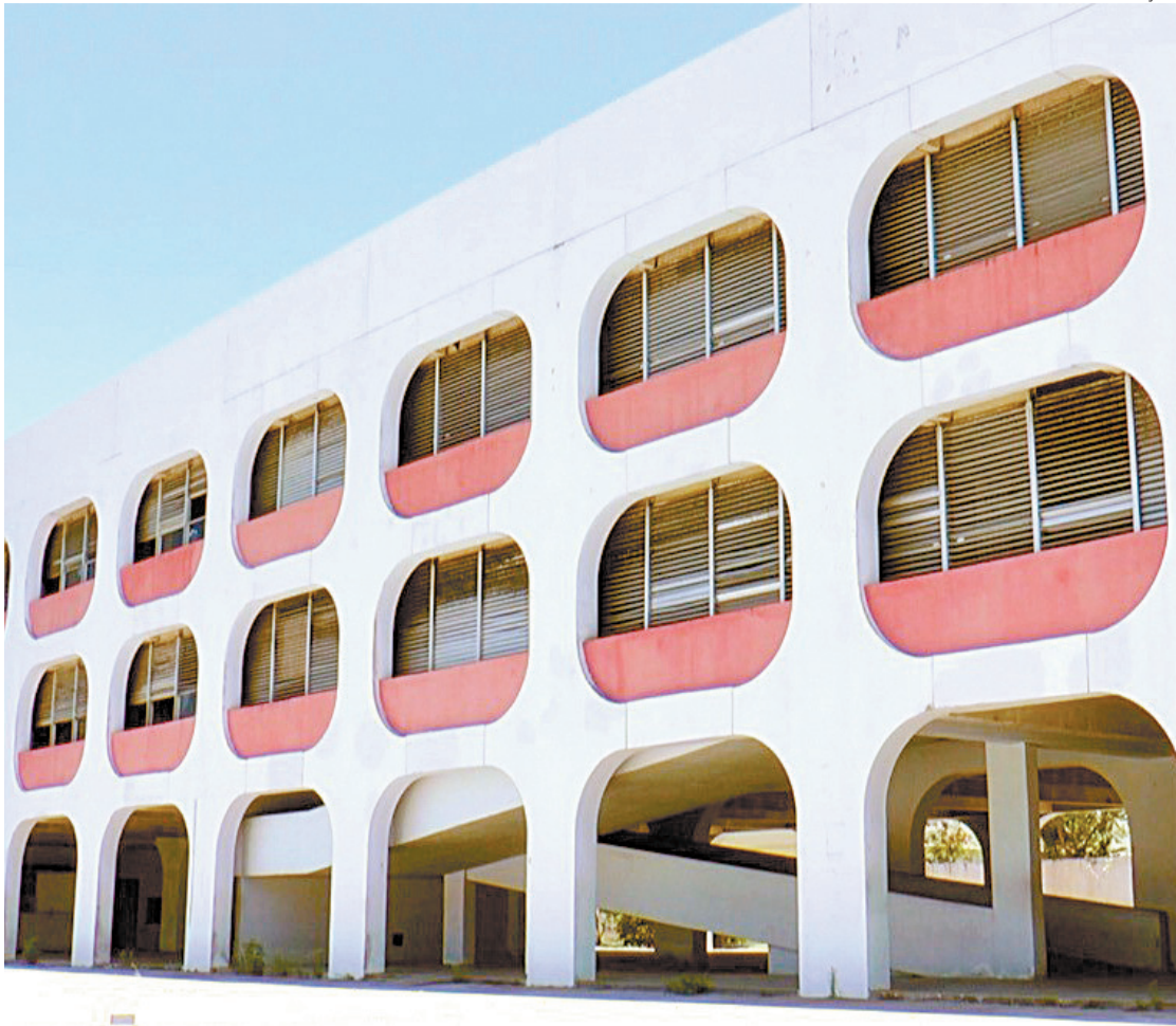
Secretaria diz que só unidades aptas a receber alunos, professores e funcionários serão abertas