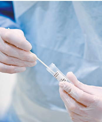
Estudo segue em produção

Ofertas válidas até sexta-feira (30/04/2021), ou enquanto durarem nos estoques. Formas de pagamento: A Vista - Pagamento no ato da compra em Dinheiro ou Cartão de Débito. A Prazo - Em até 12 vezes sem juros nos Cartões de Crédito (Sujeito a aprovação do banco emissor) - 1º pagamento no vencimento do cartão, as demais nas próximas faturas de acordo com o número de parcelas. Os produtos anunciados poderão não estar expostos em todas as lojas. Condições especiais para este anúncio. Fotos meramente ilustrativas. Garantia do Fabricante. Reservamo-nos o direito de corrigir possíveis erros de digitação.