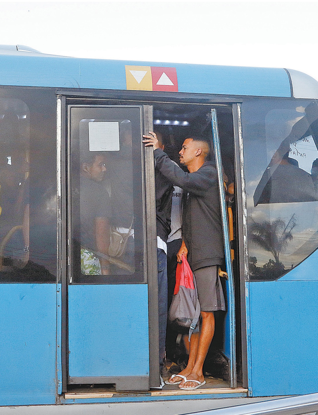
Movimentação no transporte BRT, na Zona Oeste do Rio: movimentação na estação BRT Magarça

EMENDAS Os vereadores incluíram outras emendas ao projeto. Uma delas autoriza a doação de recursos e bens por parte de empresas privadas, sem contrapartida. A Câmara adicionou ao texto o projeto que cria o 'BRT Presente', programa de policiamento nos mesmos moldes do 'Segurança Presente' que atua nos bairros do Rio. Devem ser gastos cerca de R$ 76 milhões no investimento em patrulhamento e recuperação.