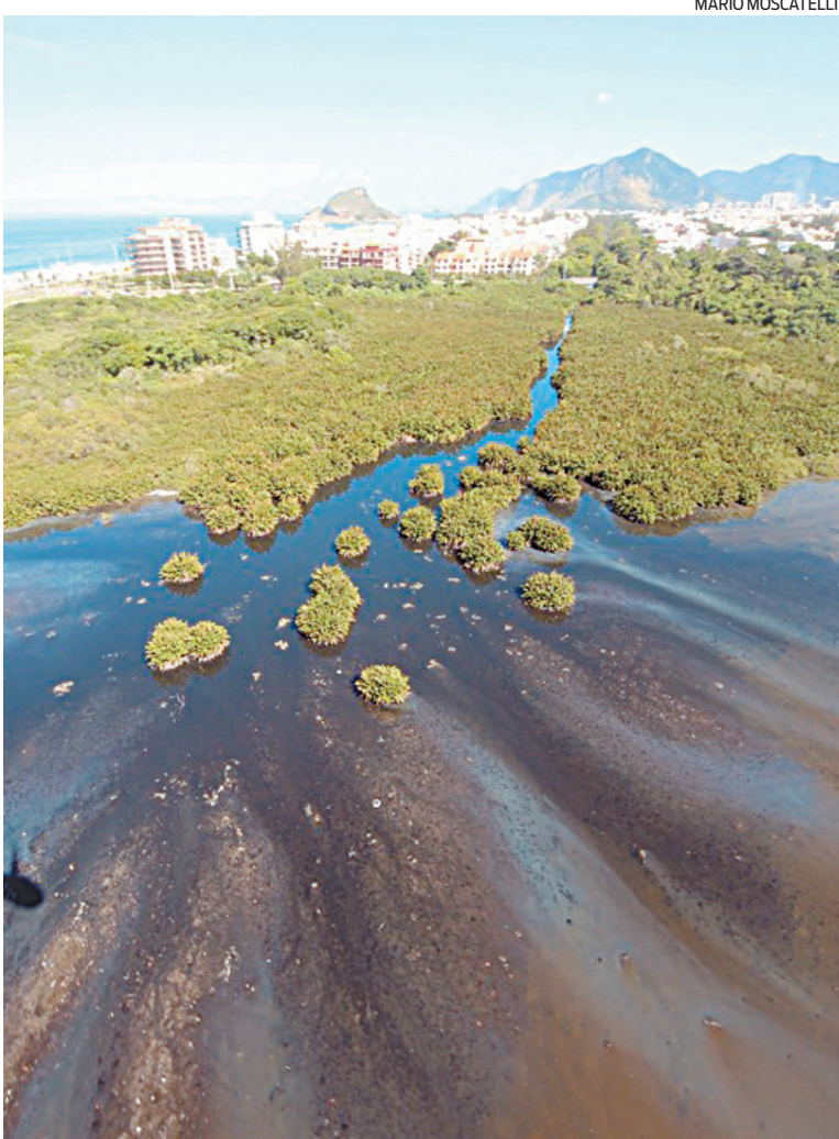
Sistema lagunar de Jacarepaguá tem saída de esgoto

Na última semana foi denunciada a mortandade de peixes, na região das praias de Guaratiba, na Zona Oeste da capital, especialmente na Baía de Sepetiba, onde foram mostradas inclusive saídas de esgotos direto nessa baía, juntamente com a questão do lançamento de minério. Segundo Moscatelli, “o problema existe, mas em nenhum momento se diz que, toda aquela região da Baía de Sepetiba, que é basicamente Bacia Drenante, é atendida por um Consórcio de Concessionárias Privadas, empresas especializadas para coleta e tratamento de esgoto, na chamada AP5, há praticamente dez anos, que certamente serão os futuros compradores da Cedae. Não dá para esconder este fato relevante”.