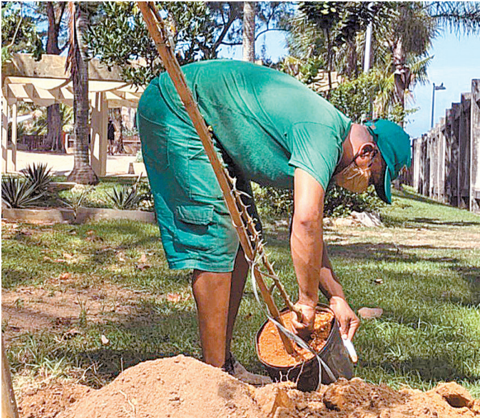
Diversas áreas da cidade receberam mudas de diversas espécies

Para se cadastrar, o interessado deve acessar o site carioca.rio, clicar em ‘Auxílio Carioca’, e informar o CPF para verificar se está apto a receber. O cadastro será atualizado e a pessoa receberá um SMS de confirmação pelo celular. Assim, uma conta digital será automaticamente criada. Para desbloquear a conta, basta baixar o aplicativo ‘Superdigital’. O primeiro saque na Rede 24 horas é gratuito, mas o cartão virtual pode ser usado como cartão de débito normalmente. Para tirar dúvidas, entre em contato com a prefeitura pelo telefone 1746.