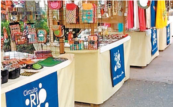
Secretaria de Fazenda e Planejamento incluiu novos grupos no auxílio