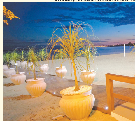
Orla Oscar Niemeyer