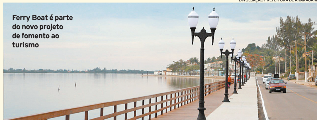
Ferry Boat é parte do novo projeto de fomento ao turismo