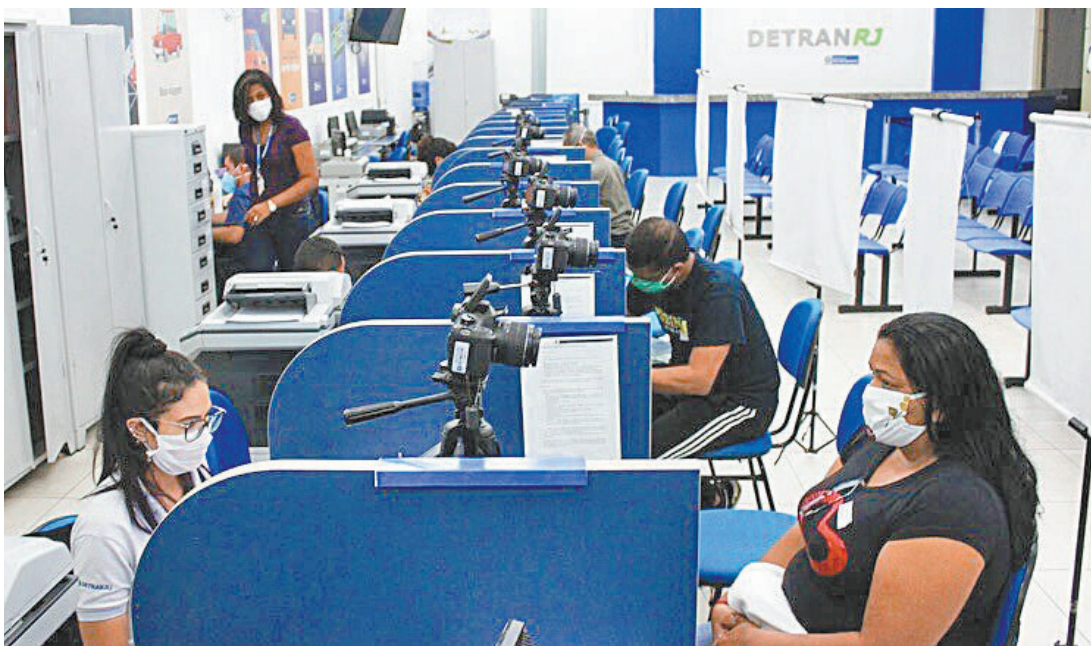
Para evitar aglomerações, o atendimento só será possível mediante agendamento prévio

Para realizar a segunda via da identidade ou emitir a carteira SEAP, o atendimento será das 8h às 16h, nas unidades: sede (Centro do Rio), Américas Shopping, Araruama, Barra Mansa, Cabo Frio, Campo Grande, Campos dos Goytacazes, Center Shopping, Ilha do Governador, Itaguaí Shopping Mix, Largo do Machado, Macaé, Macuco, Méier, Mesquita, São Gonçalo (Neves), Nova Friburgo, Paraty, Parque Maré, Parque Shopping Sulacap, Petrópolis, Saracuruna, São Gonçalo (Rocha), São João