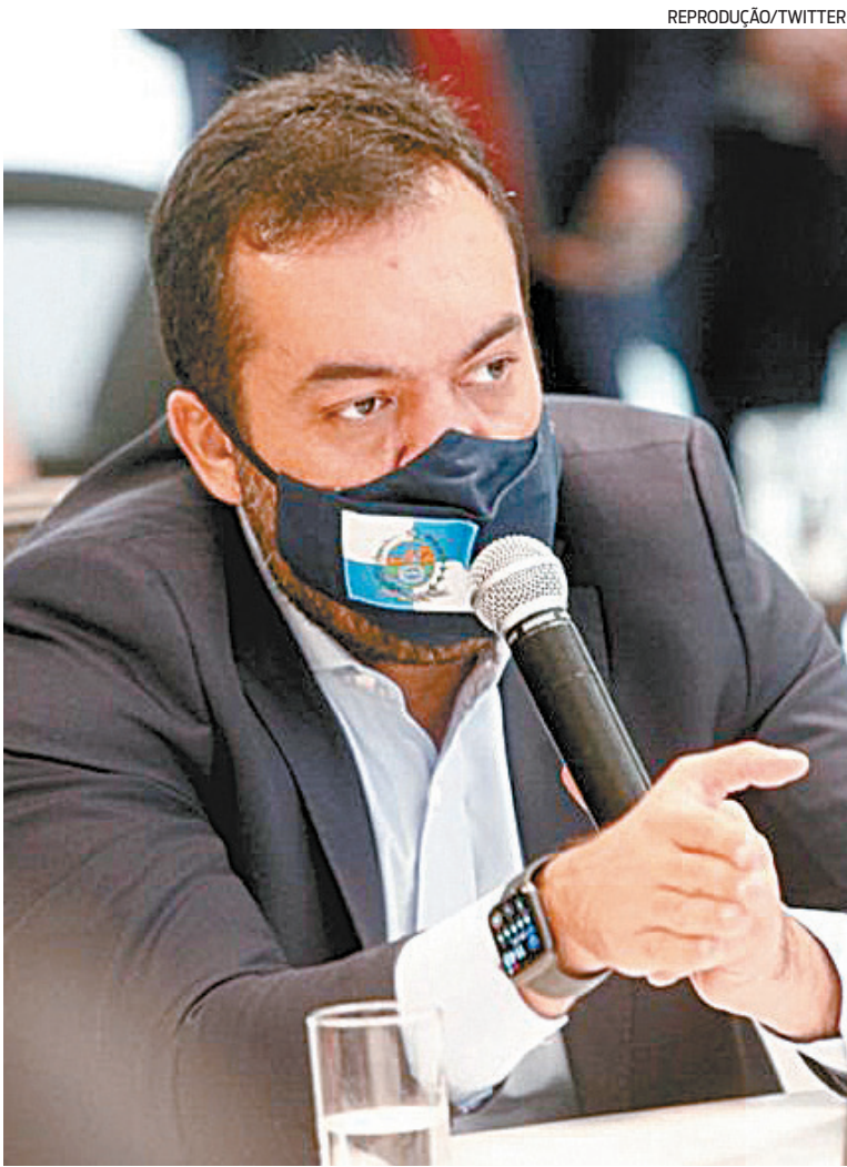
Governador Cláudio Castro busca saídas para sair da crise.

“Eu assumi dia 28 de agosto com déficit nas contas públicas na casa de R$ 6,2 bilhões, com a difícil missão de pagar os salários dos servidores de novembro, dezembro e 13º. Começamos um trabalho de tentar recuperar e tentarmos achar maneiras de sairmos dessa crise. O Estado tinha uma situação muito difícil, não dialogava bem com a cadeia produtiva, não dialogava bem com a Alerj, não dialogava com o governo federal, não dialogava com os outros poderes, então começamos um trabalho de resgate do Rio de Janeiro, recuperando as pontes com o governo federal, com a Alerj, voltamos a dialogar com a cadeia produtiva. Até no momento mais complicado da pandemia, fazia e continuo fazendo reuniões periódicas com a cadeia produtiva”.