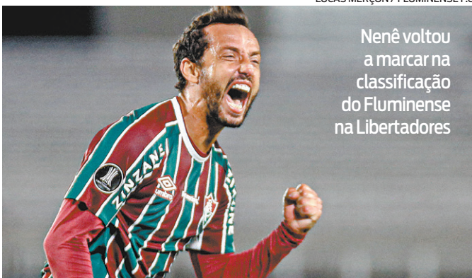
Nenê voltou a marcar na classificação do Fluminense na Libertadores