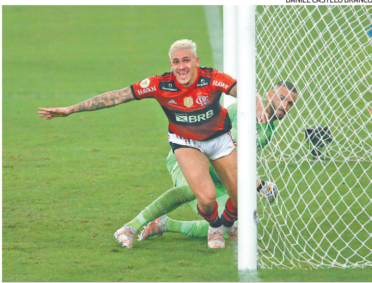
Pedro fez o gol após linda jogada de Bruno Henrique pela esquerda

Aos 36, Diego Alves salvou o Flamengo. Luiz Adriano recebeu no campo de defesa e deu bonito passe em profundidade para Rony. O atacante disparou, dominou e tirou de Gerson. Ele ajeitou o corpo e bate com o pé direito, mas