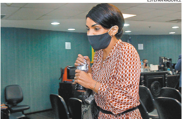
Mandato será decidido no plenário, Flordelis ainda pode recorrer

mento da delação premiada de Nythymar envolvendo Bretas. Em sua fala à PGR, o advogado cita a existência de uma articulação entre o magistrado da 7ª Vara e a força-tarefa da Lava Jato no Rio para derrubar o ministro Gilmar Mendes, do Supremo Tribunal Federal. De acordo com Pezão, Nythymar o procurou dizendo que poderia ajudar no processo e pediu para ser contratado como seu advogado de defesa. Sobre as acusações feitas no âmbito da operação Boca de Lobo, que resultaram na condenação de Bretas, o ex-governador do Rio disse que desconhece os valores mencionados pelo juiz e que suas finanças não apontam para a quantia milionária citada na condenação. O advogado Nythymar foi procurado pela reportagem para dar sua versão sobre a conversa relatada por Pezão, mas até o fechamento desta matéria não se pronunciou.