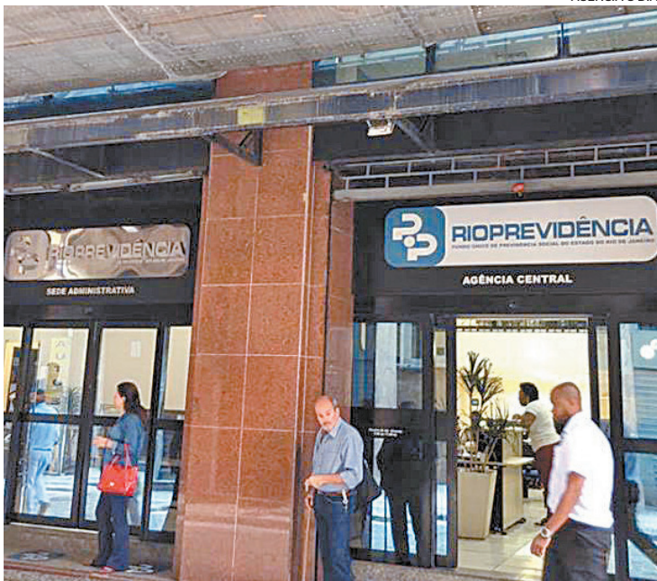
Rioprevidência é responsável pelas aposentadorias do estado