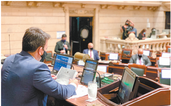
Projeto de lei será votado ainda em segunda discussão